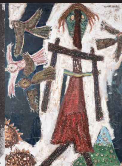
TITELSEITE: Franz Frank, Proletarisches Altarbild, 1928 Alfred Hrdlicka, Bauer mit Morgenstern, 1981